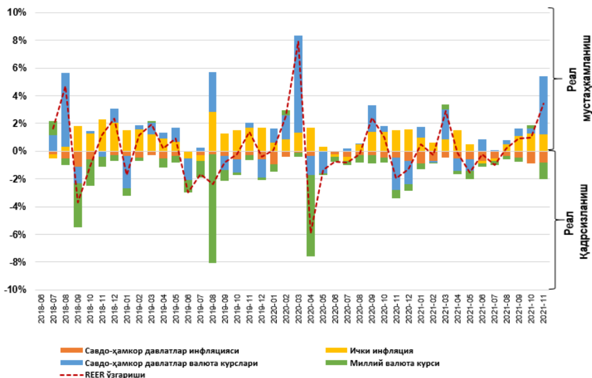
Реал самарали алмашув курси (REER) индексининг ўзгариш декомпозицияси

Ноябрь ойида ҳам асосий савдо-ҳамкор давлатларнинг деярли барчасида инфляция кўрсаткичи ўсишда давом этди: