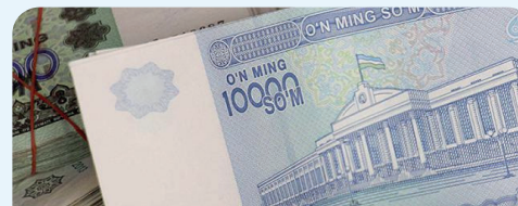
Айланмадаги пул маблағлари ва товарлар