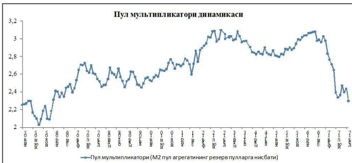
Манба: Марказий банк

Умуман олганда, пул массасининг ЯИМ номинал ҳажмига нисбатан мўътадил даражада ўсиши инфляция босимининг сезиларли кучайишини олдини олишга хизмат қилди. Шу билан бирга, ушбу кўрсаткичлар ўртасида аниқ боғлиқликнинг мавжуд эмаслиги резерв пуллар ва пул массаси аниқ даражасини ҳисоблаш имкониятини бермайди.